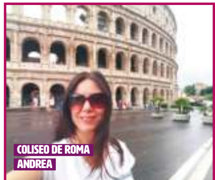
COLISEU DE ROMA ANDREA

Após o café da manhã, fim dos nossos serviços.