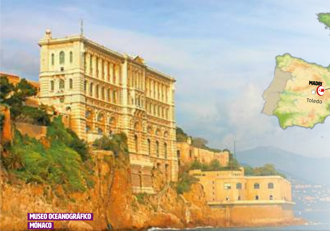
MUSEU OCEANOGRÁFICO MÔNACO