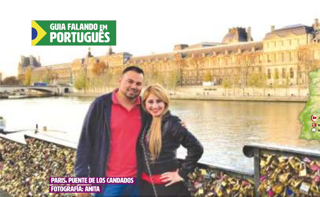
PARIS, PUENTE DE LOS CANDADOS