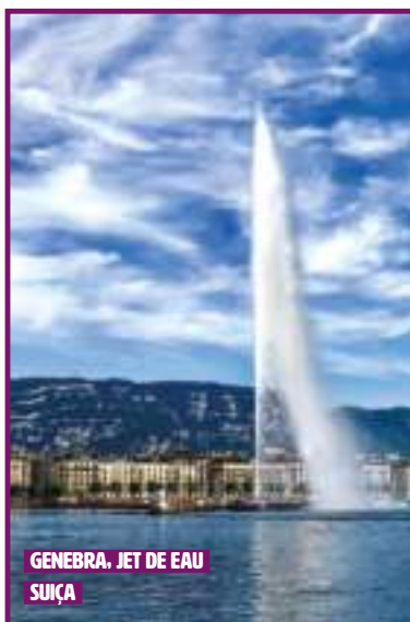
GENEVA, JET DE EAU SUIÇA

Veja os hotéis previstos para esta viagem na parte final do folheto e na sua página web "Minha Viagem".