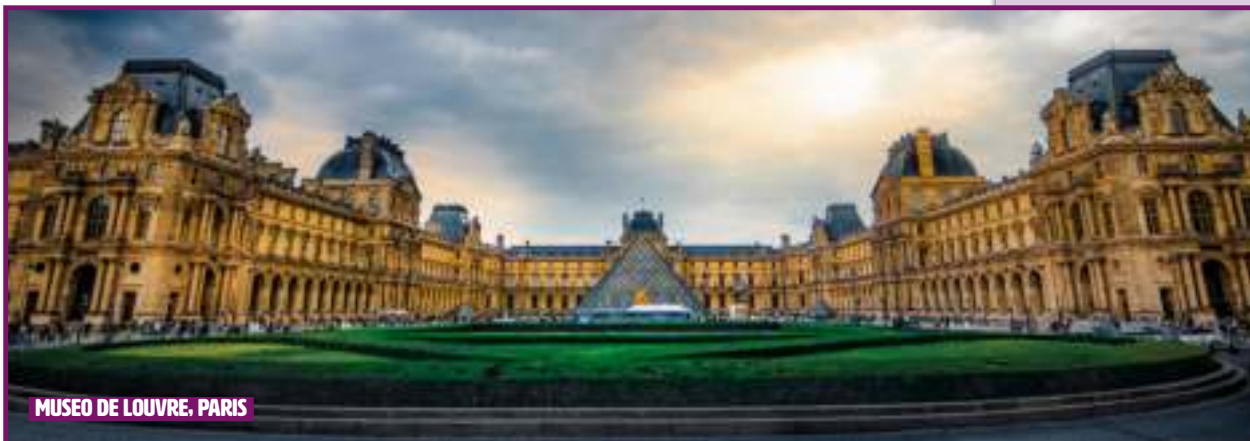
MUSEU DE LOUVRE, PARIS