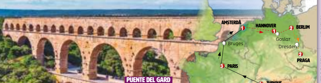
PUENTE DEL GARD